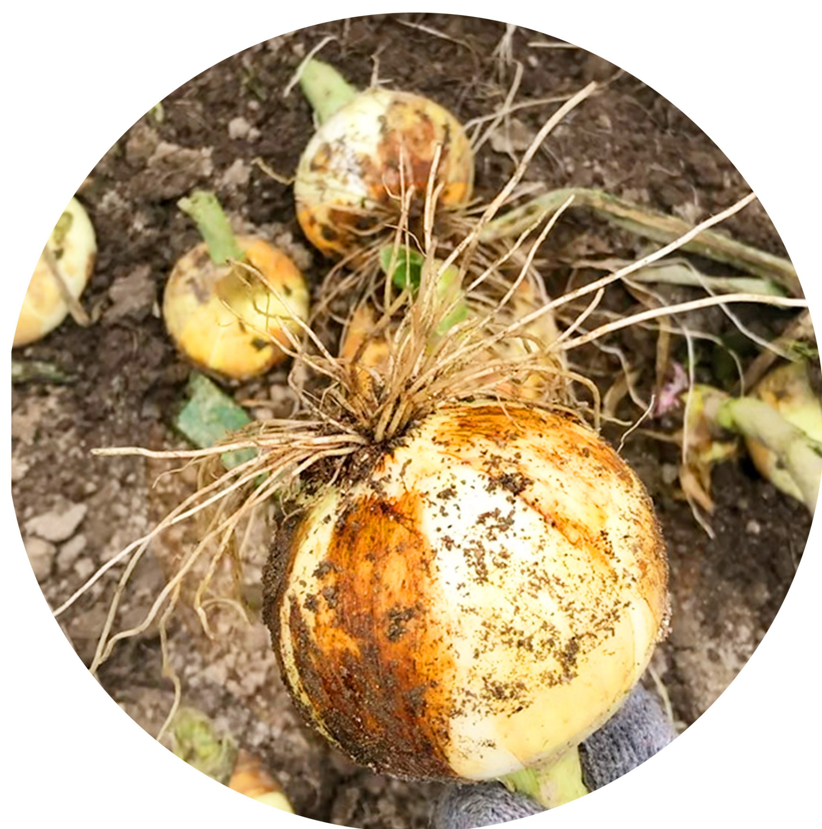
根切り後の玉ねぎ